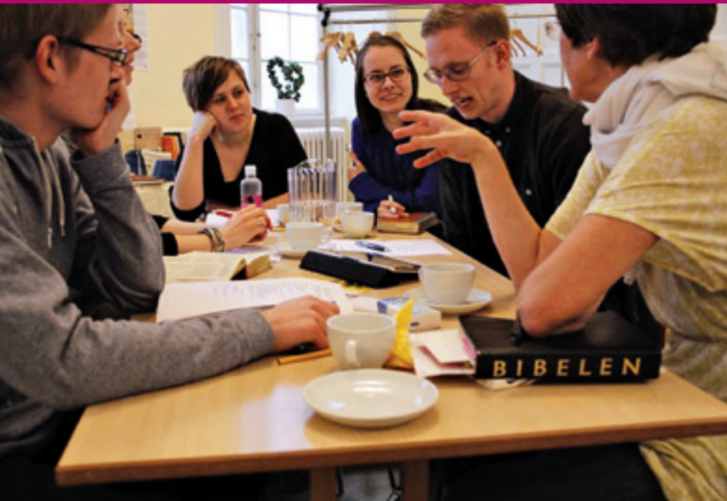
Mindst én gang om året inviterer EA til en temadag, hvor der sættes fokus på et aktuelt emne.

Evangelisk Alliances nyhedsbrev udkommer månedligt. Du kan tilmelde dig på Evangelisk Alliances hjemmeside eller via facebook.